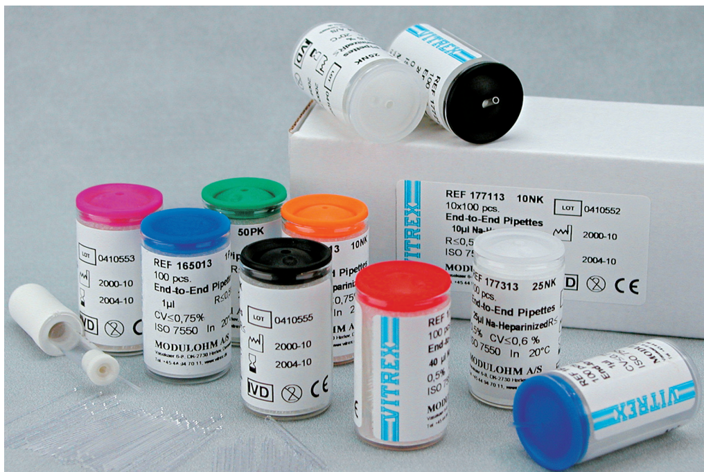
1404 Pipette holder - Pipettenhalter - Porte pipettes - Portapipetta - Portapipeta